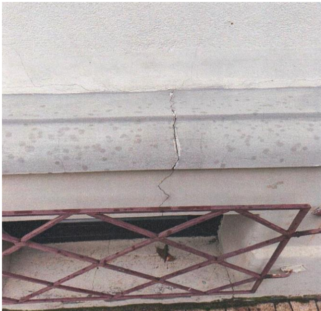
zdj. nr 10 – fragment elewacji przeznaczony do remontu