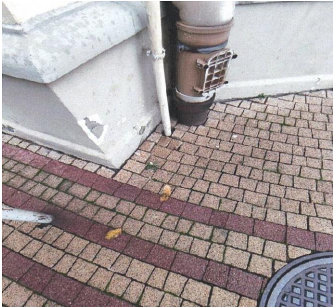
zdj. nr 12 – fragment elewacji przeznaczony do remontu