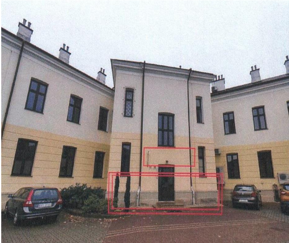
zdj. nr 3 – miejsce montażu zadaszania lekkiego nad wejściem bocznym