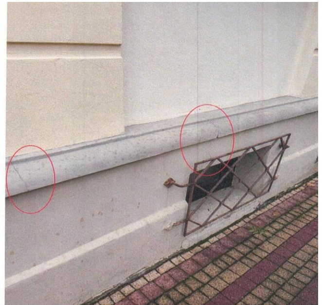
zdj. nr 11 – fragment elewacji przeznaczony do remontu