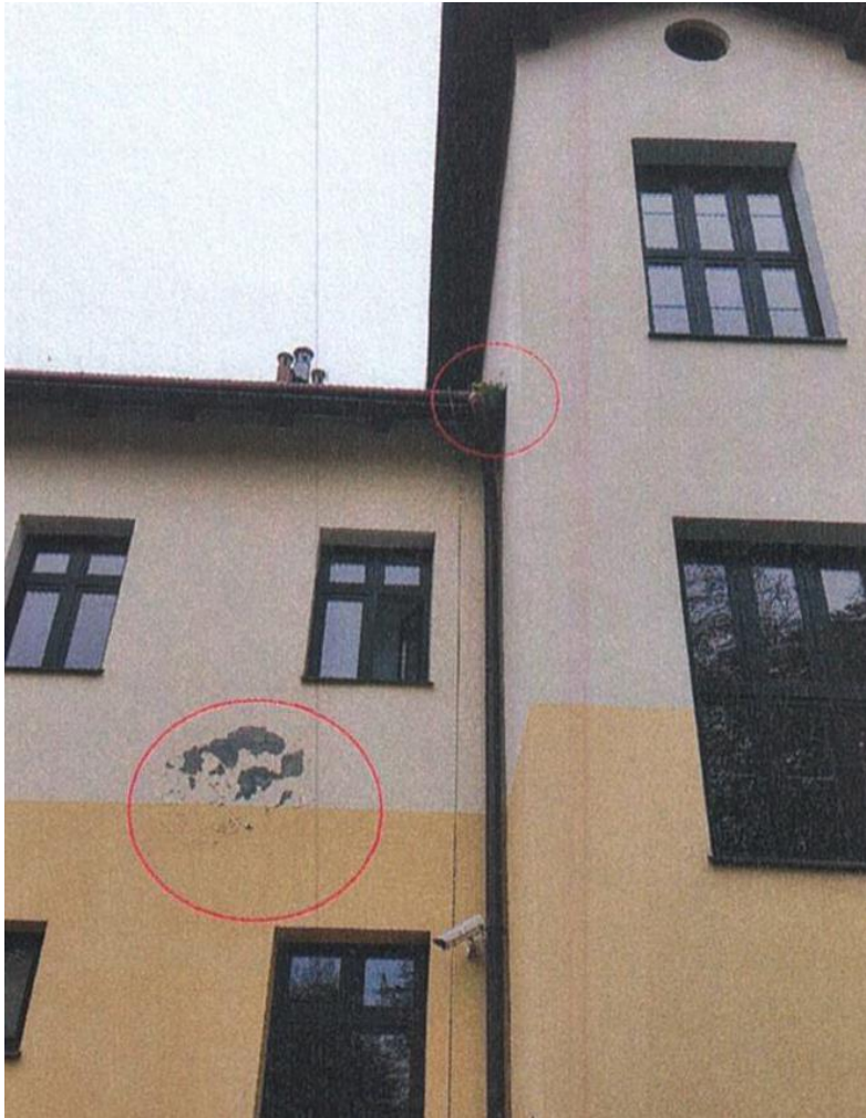
zdj. nr 9 – fragment elewacji przeznaczony do remontu