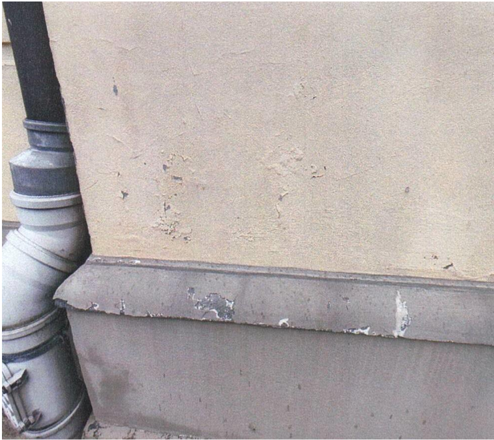
zdj. nr 5 – fragment elewacji przeznaczony do remontu