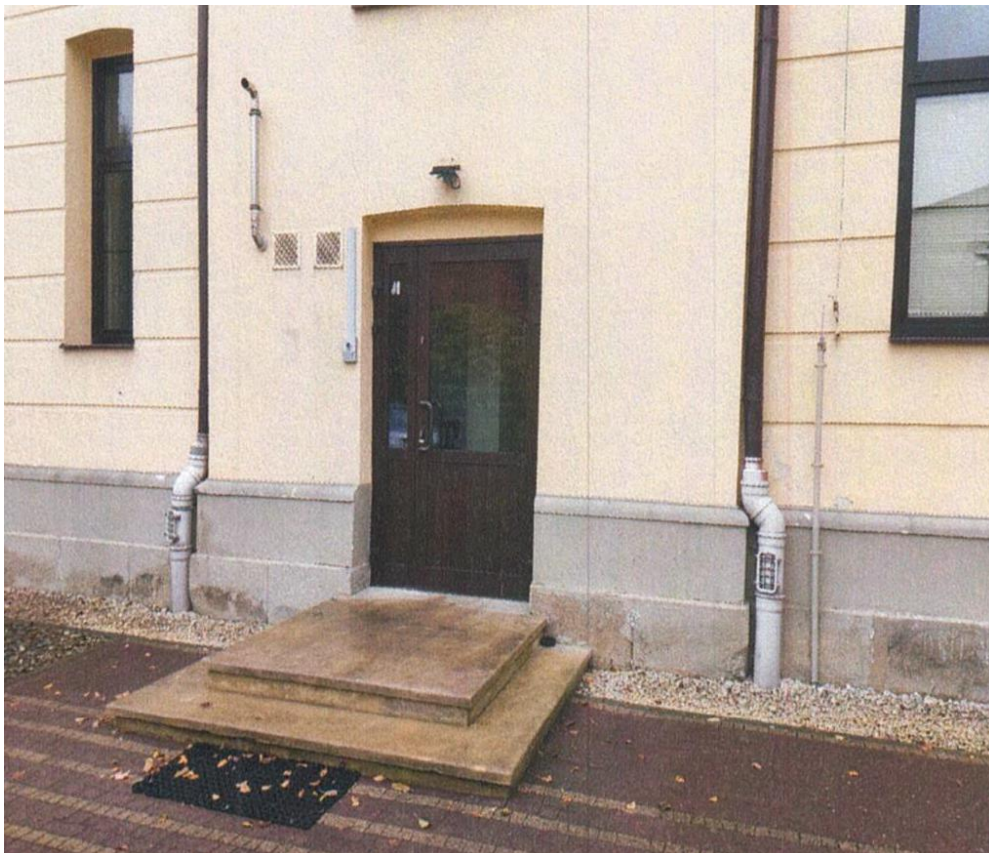
zdj. nr 4 – miejsce montażu zadaszania lekkiego nad wejściem bocznym