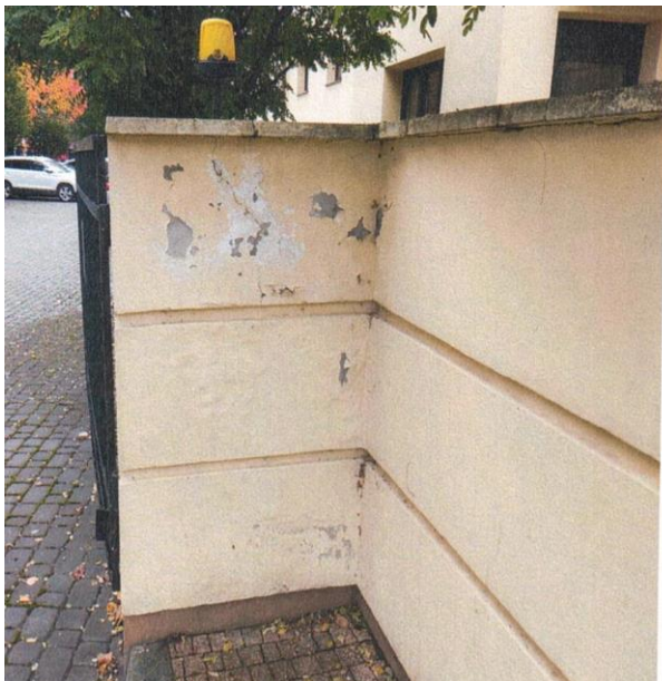
zdj. nr 16 – fragment elewacji przeznaczony do remontu