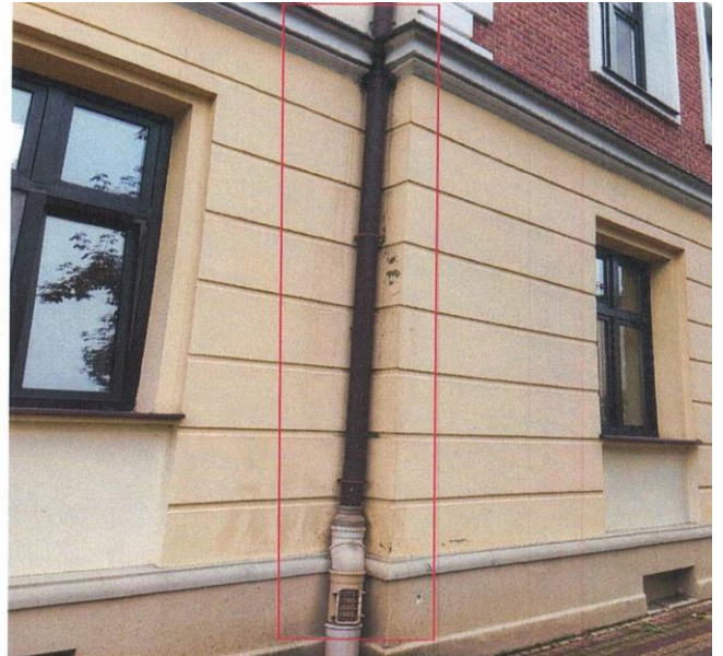
zdj. nr 13 – fragment elewacji przeznaczony do remontu