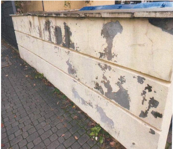
zdj. nr 15 – fragment elewacji przeznaczony do remontu