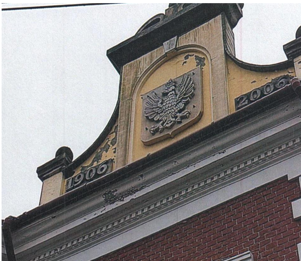
zdj. nr 2 – fragment elewacji przeznaczony do remontu