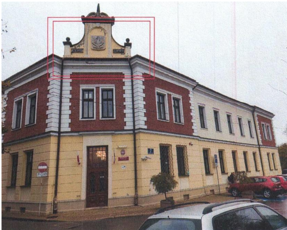
zdj. nr 1 – fragment elewacji przeznaczony do remontu oraz montażu zadaszenia nad wejściem głównym