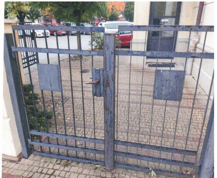
zdj. nr 17 – renowacja elementów stalowych