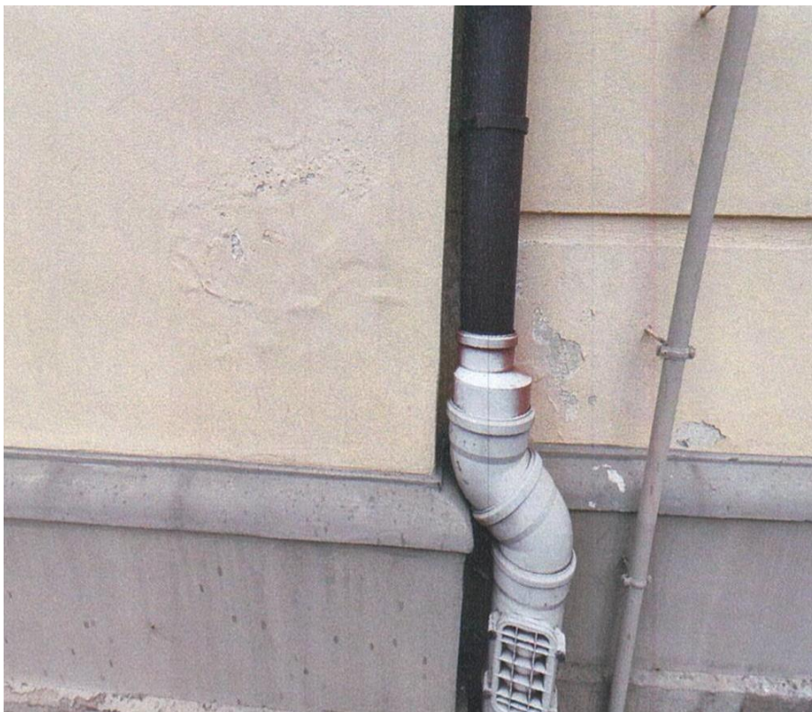
zdj. nr 6 – fragment elewacji przeznaczony do remontu