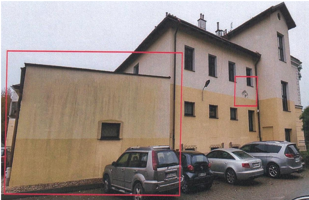
zdj. nr 8 – fragment elewacji przeznaczony do remontu