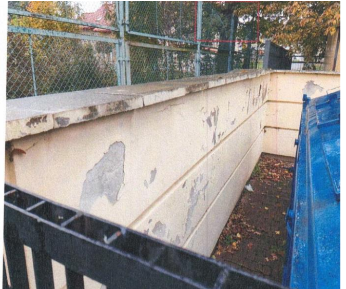
zdj. nr 16 – fragment elewacji przeznaczony do remontu