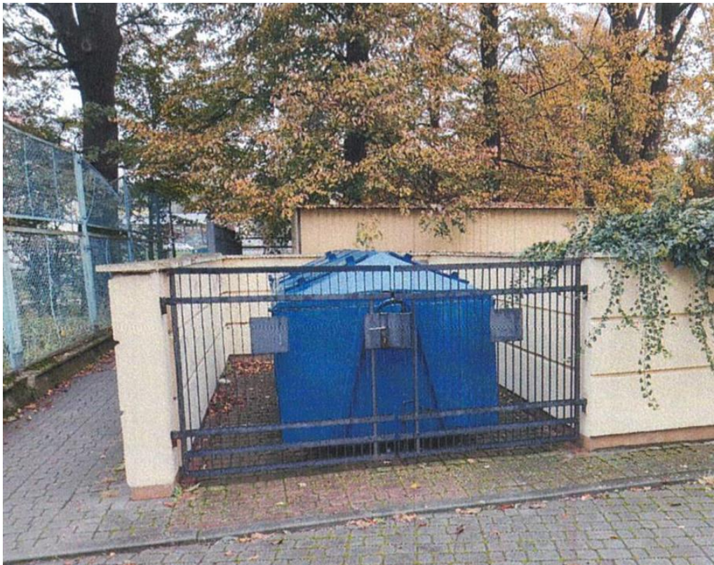
zdj. nr 14 – renowacja elementów stalowych